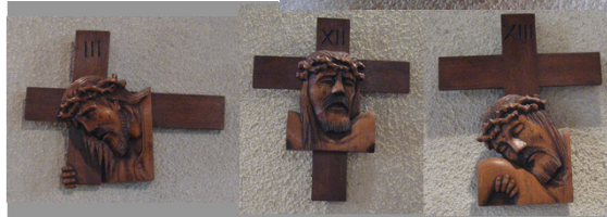
Chemin de Croix rare et expressif, seul le visage du Christ apparaît à chaque station (sculptures de Marcel ROSSET - Éteaux)