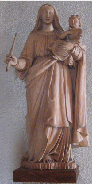
Vierge à l'enfant en bois ▷