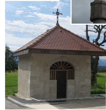
△ chapelle (1860) Notre Dame de l'Immaculée Conception oratoire Notre Dame de l'Aumône (1921) ▷