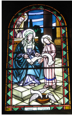
△ Marie et sa mère, Ste Anne