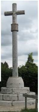
△ croix médiévale