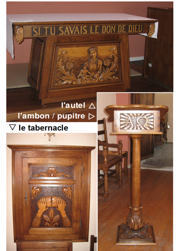
l'autel ▲ l'ambon / pupitre ▷ ▽ le tabernacle

Nous savons que le chœur de notre église est consacré en 1481 par l'évêque de Genève, mais sa construction donc notre communauté, est plus ancienne.