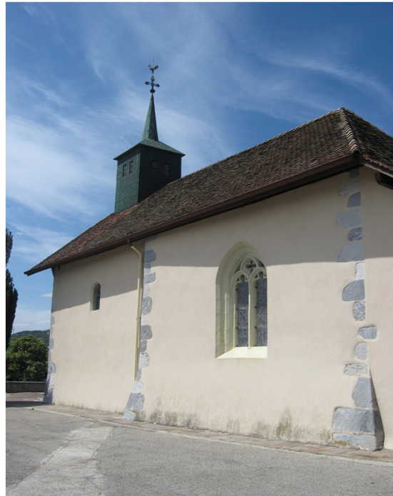
le coté sud avec sa fenêtre gothique

Père, merci pour ces hommes, ces femmes que tu conduis sur nos chemins pour qu'ils soient des signes pour ce temps.