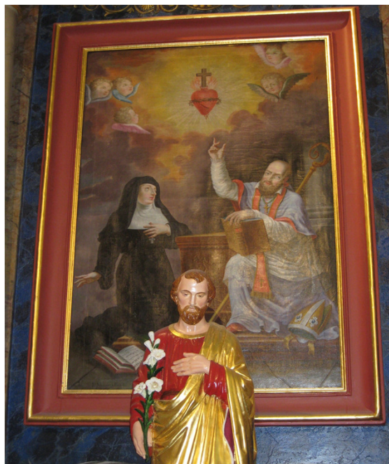
chapelle de gauche : Saint Joseph

adapté de la prière du fantassin à St Maurice