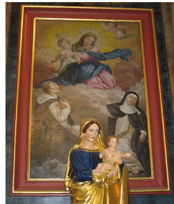
chapelle de droite : Sainte Marie

Avec plus de 3 600 habitants, l'activité de notre bourg est des plus diversifiée.