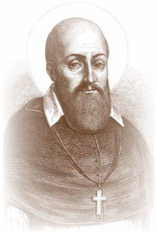
Saint François de Sales.

En outre, « l'humilité qui cache et couvre les vertus pour les conserver, les fait néanmoins paraître quand la charité le commande » : ne pas agir sous prétexte d'humilité, c'est de