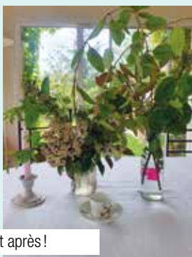
Avant... et après!