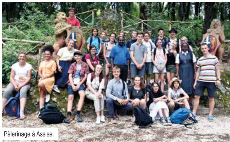
Pèlerinage à Assise.

Contacts : 06 68 07 41 24 ou 06 70 12 58 64