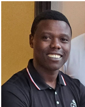
P. 10 Il en pense quoi, le curé?