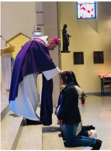
P. 6 & 7 Sacrements