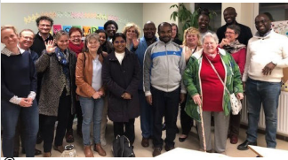
P.4 Quand l'E A P de Saint Benoît visite les Services