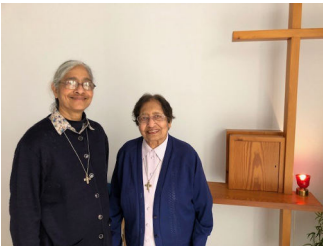
P.8 Que sont devenues Sœurs Muriel, Thérèse et Jessy ?