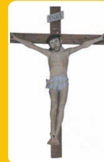
4- Christ 17 e - Cuvat

Signe des chrétiens, rappelant que Jésus est mort et ressuscité pour tous. Par sa résurrection, il sauve et libère, puisque à sa suite, la mort est passage vers la vie auprès de Dieu.