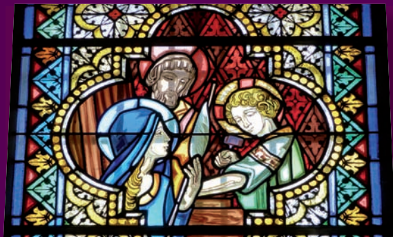
Vitrail de la Sainte Famille, église de Saint-Paul en Chablais

En plein milieu de cette journée, assailie de travail, d'efforts, de soucis, de brouhaha, me voici Seigneur, seule dans cette église, le temps d'une brève rencontre.