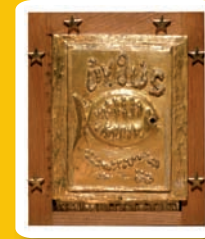
1- N.D. de Toute Grâce - Plateau d'Assy

La lumière rouge allumée est le signe de la présence réelle du Christ dans les hosties consacrées, conservées à l'abri en cette réserve eucharistique. Ichthus (poisson en grec) signifie : Jésus Christ, fils de Dieu Sauveur. Il est le premier signe de reconnaissance des chrétiens.