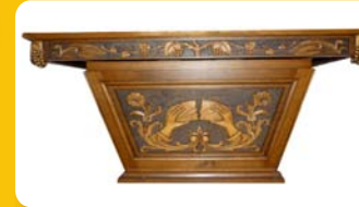
2- église de Saint-Sixt

Table rappelant celle sur laquelle Jésus a célébré son dernier repas (la Cène). Lors de la messe, le prêtre reproduit les mêmes gestes en offrant à Dieu le pain et le vin. En consacrant ce pain et ce vin, Dieu donne en retour ce qu'il a de plus précieux : son fils. C'est le mystère de l'eucharistie.