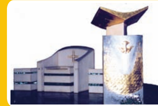
3- église Saint-Joseph, Annemasse

L'ambon est le support de la Parole de Dieu (la Bible), à partir duquel celle-ci est proclamée. Le siège du prêtre, légèrement surélevé et se distinguant des autres par sa facture, signifie la présidence du célébrant.