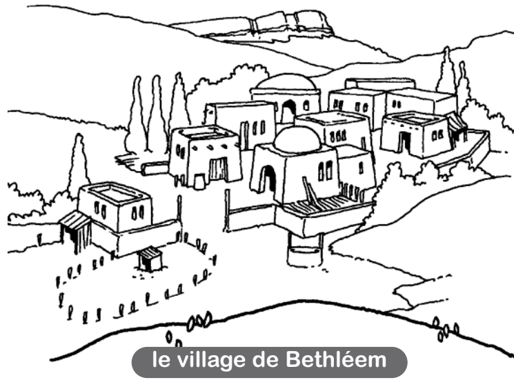
le village de Bethléem