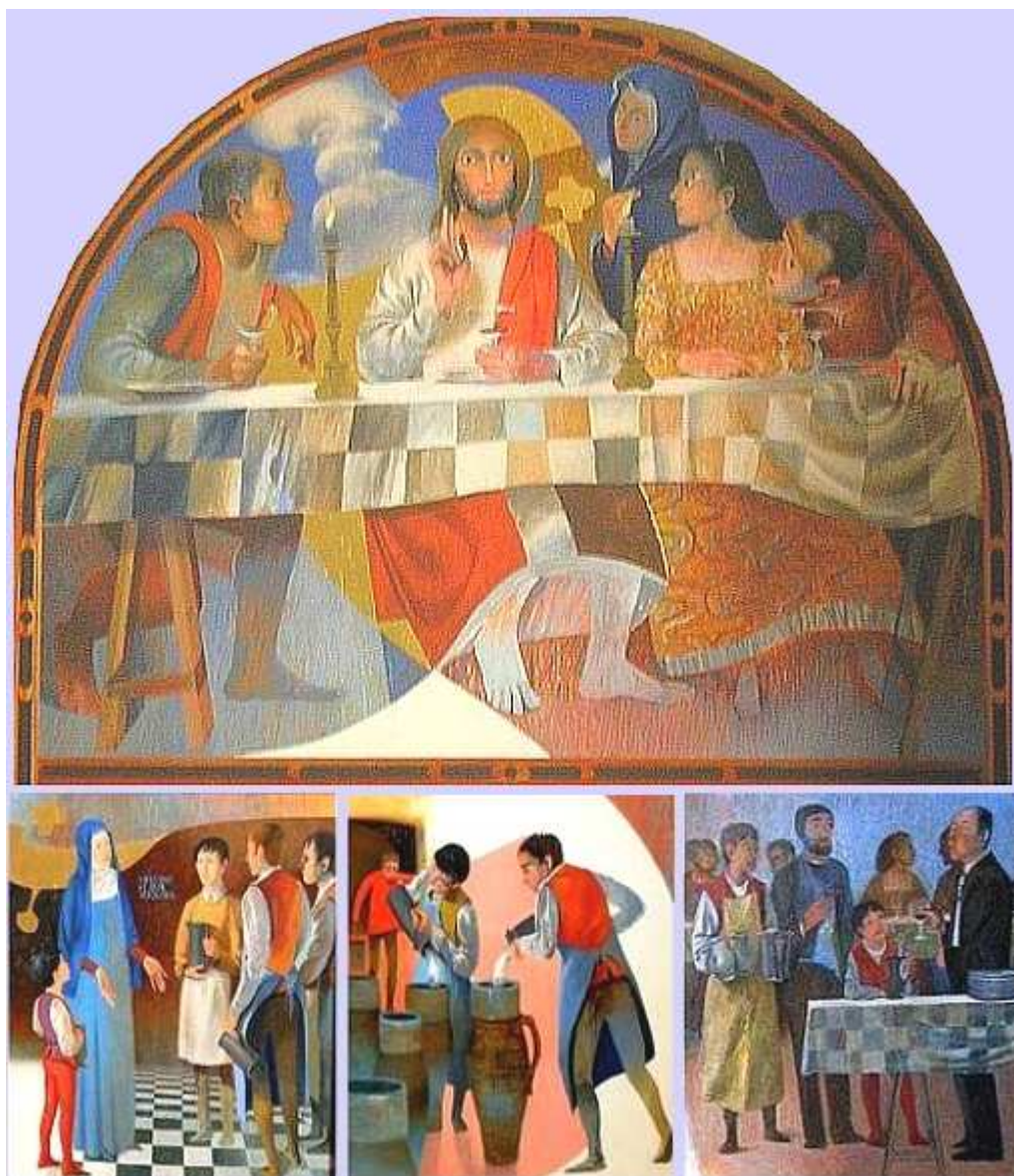
Du peintre Arcabas