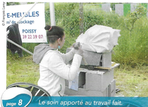
page 8 Le soin apporté au travail fait.