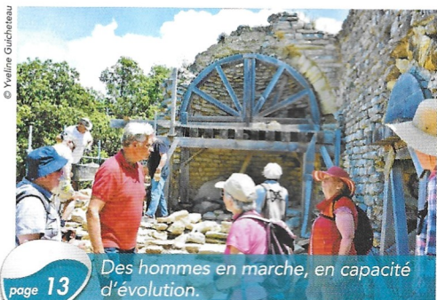
page 13 Des hommes en marche, en capacité d'évolution.