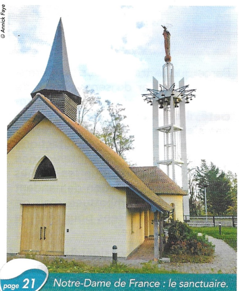
page 21 Notre-Dame de France : le sanctuaire.