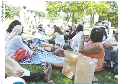
page 17 La joie de la rencontre et du partage.

P ar les temps qui courent vouloir parler de rire ou sourire peut sembler une gageure, et pourtant ! Croiser un visage souriant provoque souvent, instantanément un sourire. Les personnes gaies, affables, aimables sont la plupart du temps souriantes. Le sourire engendre des ondes positives, il apaise, facilite le contact et souvent désamorce les conflits.