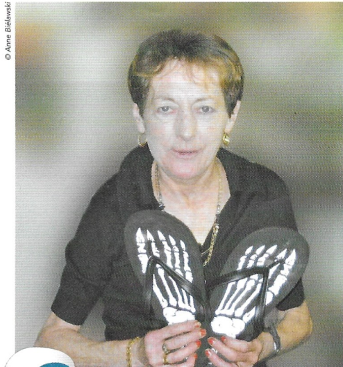
page 4 Exorciser nos peurs et nos angoisses.