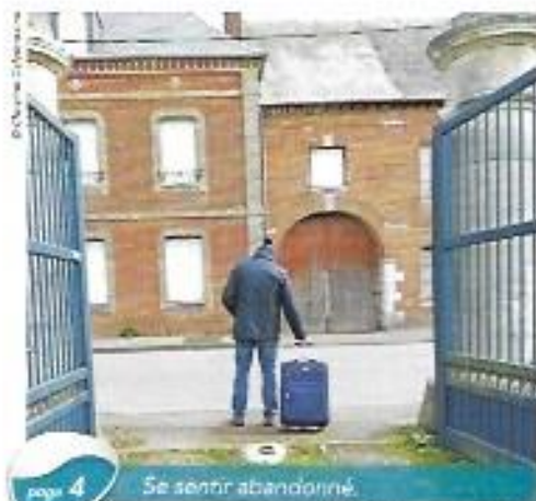
page 4 Se sentir abandonné.