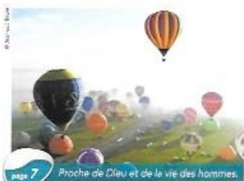
page 7 Proche de Dieu et de la vie des hommes.