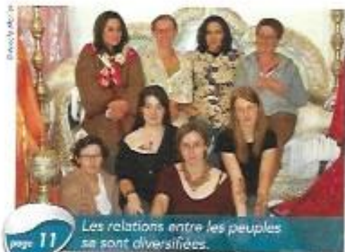
page 11 Les relations entre les peuples se sont diversifiées.