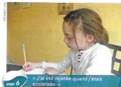
page 6 « J'ai été rejetée quand j'étais scolarisée. »