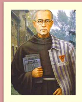
Saint Maximilien Kolbe