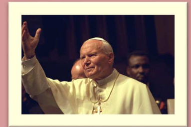
Saint Jean Paul II,