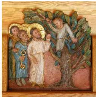
Détail de la miniature de saint Martial (abbaye Sainte-Scholastique, Clermont, Tarn), Abbaye Notre-Dame-des-Vignes.