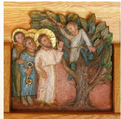
Détail de la miniature de saint Martial (abbaye Sainte-Scholastique, Clermont, Tarn), Abbaye Notre-Dame-des-Vignes.