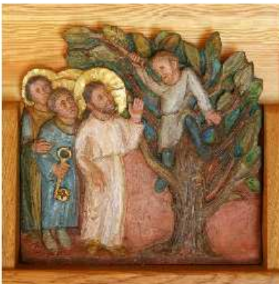
Détail de la miniature de saint Martial (abbaye Sainte-Scholastique, Clermont, Tarn), Abbaye Notre-Dame-des-Vignes.