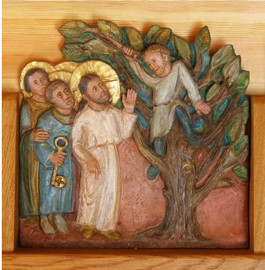
© Détail de la céramique de sœur Mercédès (abbaye Sainte-Scholastique, Dourgne, Tarn), Abbaye Notre-Dame-des-Neiges. Photographie de Bruno Wadoux.

Pendant le temps enfants, les parents peuvent regarder le même texte d'évangile. Avant de le lire, nous vous proposons de découvrir cet évangile par une lecture d'image.