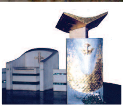
3- Ambon et siège, église St Joseph Annemasse