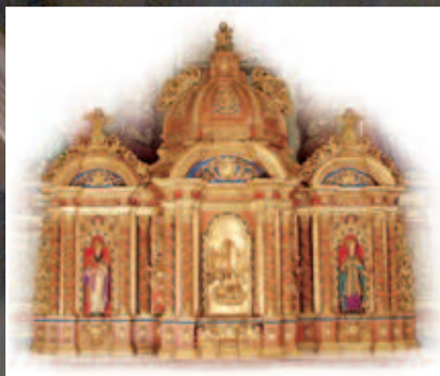
1-Tabernacle, église d'Argentière