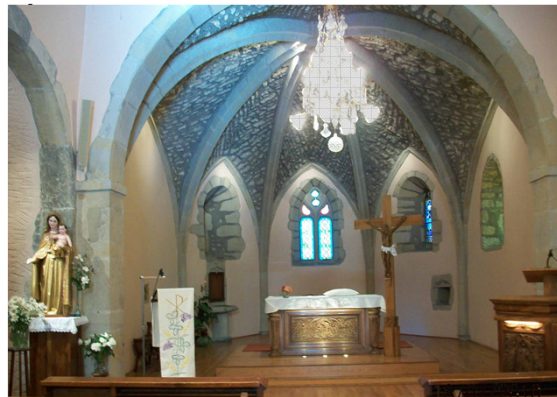
église de Saint SYMPHORIEN, le chœur

pour chacune des églises des Communautés Locales de notre paroisse, vous pouvez trouver un document similaire