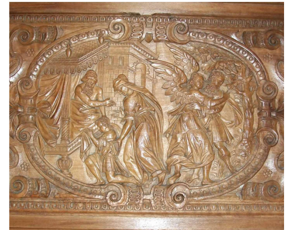
panneau central de l'autel

Connue actuellement sous le nom de chapelle Saint JACQUES , elle a été "église paroissiale" jusqu'en 1801, date à laquelle, "victime" du Concordat (un évêque par département, une paroisse par canton et une "succursale" par commune), elle a été rattaché à Saint SYMPHORIEN.