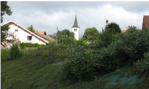
△ Saint SYMPHORIEN