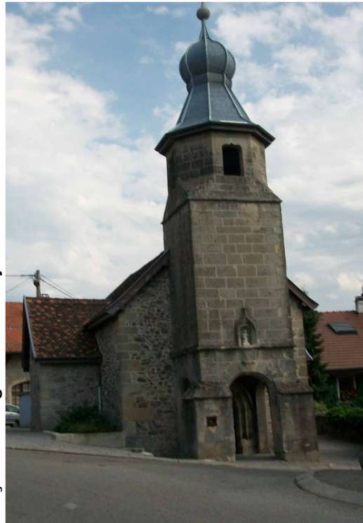
façade de l'église de Charly