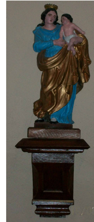
Vierge à l'Enfant du XVI ème siècle (Charly)

Andilly acquiert depuis quelques temps un renom grâce à la création du Parc des Moulins et au déroulement, chaque année, des Fêtes Médiévales.