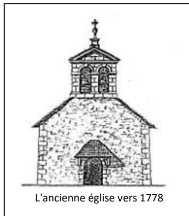
L'ancienne église vers 1778

Reconstruite et agrandie à plusieurs reprises notamment par l'architecte Charles Gallo en 1778, elle fut démolie en 1871; seul le chœur a été conservé.