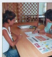
Un accompagnement personnalisé