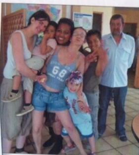
Les groupes conviviaux : être ensemble !

Tout au long de l'année, en milieu rural, urbain et carcéral, les groupes conviviaux permettent à des personnes de sortir de l'isolement en leur proposant de réaliser des projets ensemble autour d'activités variées : ateliers (couture, bricolage, cuisine, informatique...), sorties culturelles et de découvertes .