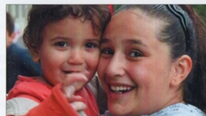
Vive les vacances en famille ou en famille d'accueil !

Chaque année, le Voyage de l'Espérance rassemble cinquante personnes, seules ou en famille, pendant une semaine pour vivre dans la convivialité et le partage fraternel.