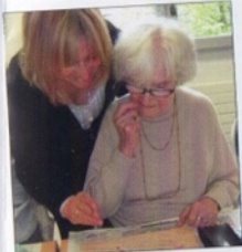
Les ateliers : activités et proximité