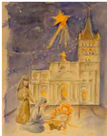
Aquarelle de Blandine Lane.

Amis, regardons autour de nous : la nuit nous enveloppe, ténèbres de la haine et de la violence, nuits des conflits qui agitent le monde, douleur d'un monde qui se cherche. Nuit de l'homme sans Dieu. Mais éveillez vos yeux : la nuit n'est pas complète. Il y a des hommes, des femmes, dont la vie montre qu'il est possible de briser les limites de l'égoïsme et de l'intolérance, pour construire un monde plus fraternel, un monde de justice et de paix. Heureusement qu'il y a eu cet enfant, venu la nuit de Noël pour croire à ce Dieu qui établit sa demeure sur la terre des hommes ! Les premiers à venir l'adorer, ce sont de pauvres bergers, des exclus qui vivaient à la marge et passaient leur nuit à garder leurs troupeaux. Un ange leur apparut et la Gloire du Seigneur les enveloppa de sa clarté : « Un Sauveur vous est né ! » Et ils partirent avec joie, annoncer la Nouvelle à tous ceux qu'ils rencontraient ! Père Philippe Muller